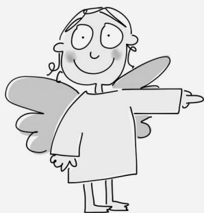
Grafik: Constanze Ebel

Hätte jemand Zeit und Lust alle zwei Monate zur Mitte des Monats mitzuhelfen?